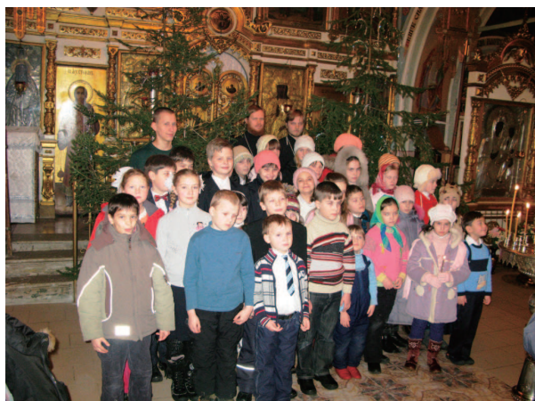
Редактор, верстка - Александр Скороходов Художник - Наталья Тимофеева

Вопросы и пожелания направлять по адресу: prihod@spas-andreevka.ru Примите не использовать газету в бытовых целях и не выбрасывать. Лучше верните ее в храм или отдайте тому, кому она может оказаться душеполезной.